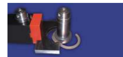
Aros en Ø y ∩