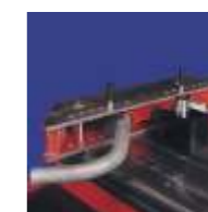
Doblado de Tubo 90° (Max2" ISO65 - DIN 2440)