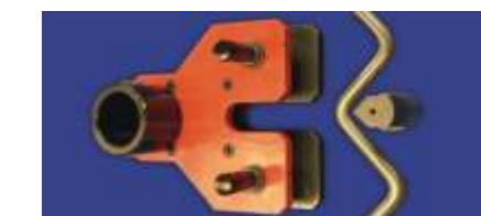
Doblado barra 90° (Max Ø30)