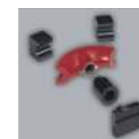
Enderezado de perfiles